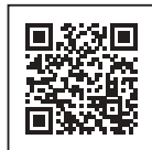
宅配搬入送り状番号申請フォーム

★引き取り漏れ防止のため、宅配搬入荷物の送り状番号をご申請ください(任意)。申請期限:3月16日(木)